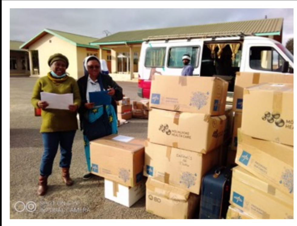
Enfants de Tsiro